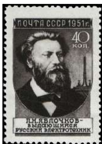
П. Н. Яблочков (1847-1894)