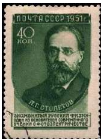
А. Г. Столетов (1839-1896)

Название серии: Ученые нашей Родины Цвет: красно-оранжевая на голубой бумаге