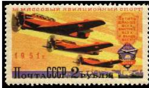
Спортивные самолеты в воздухе