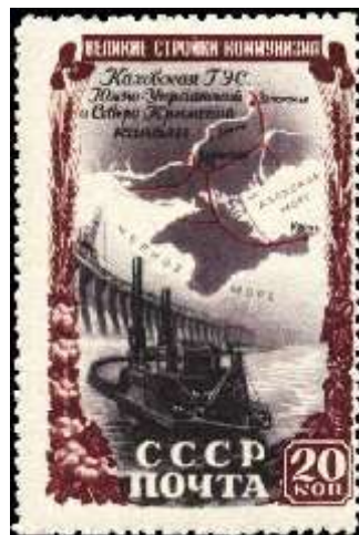
Плотина гидроэлектростанции на фоне схемы Каховской ГЭС, Южно-Украинского и Северо-Крымского каналов