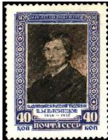
Портрет В. М. Васнецова по картине И. Крамского