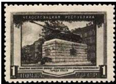
Памятник советским воинам - освободителям Праги