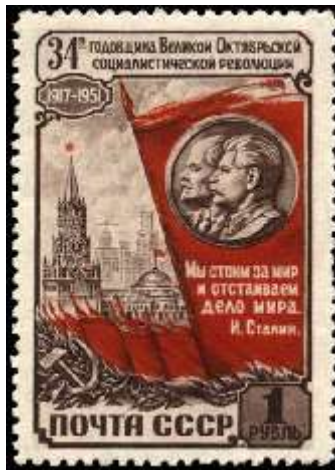
Спасская башня Московского Кремля