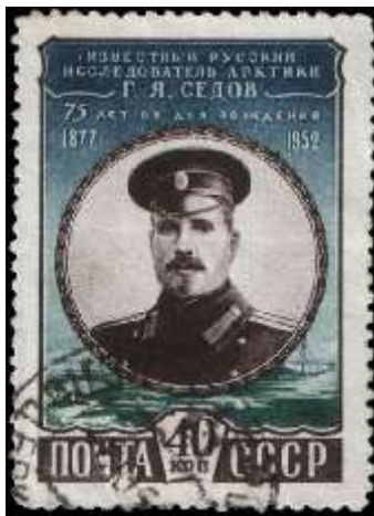
Портрет Г. Я. Седова