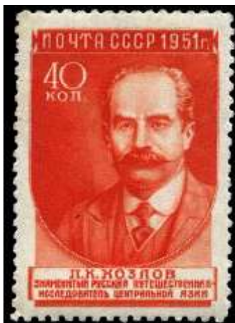
П. К. Козлов (1863-1935)