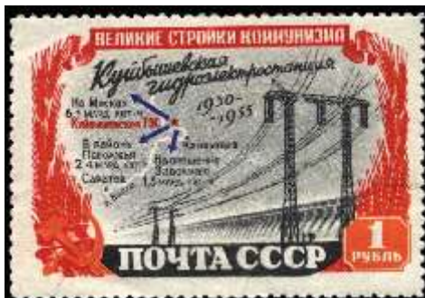
Плотина Куйбышевской ГЭС (ныне Волжская ГЭС имени В. И. Ленина )

Месяц выпуска: 11 Номинал: 60 к. Печать: офсет Зубцовка: линейная 12,5 Тираж (тыс.): 1000 Название серии: Стройки коммунизма Цвет: коричневая, синяя, красная