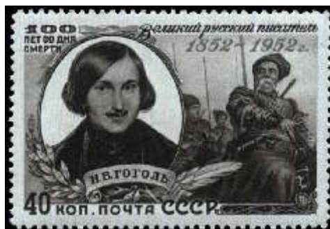
Портрет Н. В. Гоголя по картине Ф. Моллера

Номер марки: 1673 Рейтинг марки: 80 40 15 Год выпуска: 1952 Месяц выпуска: 3 Номинал: 40 к. Печать: глубокая Бумага: цветная Зубцовка: линейная 12,5 Тираж (тыс.): 1000 Название серии: В. О. Ковалевский (1842-1883) Цвет: черная на желтой бумаге