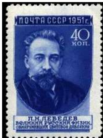
П. Н. Лебедев (1866-1912)