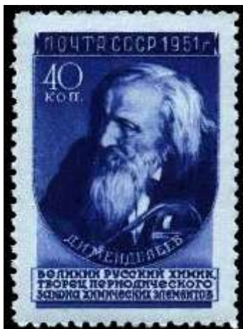
Д. И. Менделеев (1834-1907)