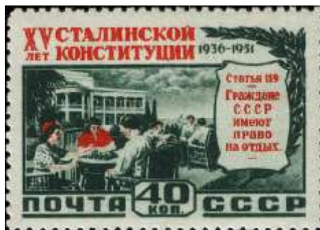
Культурный отдых трудящихся