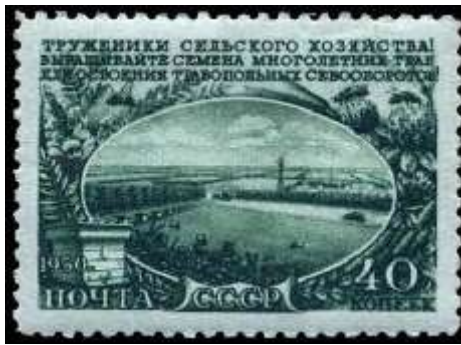
Заготовка кормовых культур

Номер марки: 1619 Рейтинг марки: 30 12 8 Год выпуска: 1951 Месяц выпуска: 6 Номинал: 40 к. Печать: глубокая Бумага: цветная Зубцовка: линейная 12,5 Тираж (тыс.): 1000 Название серии: Сельское хозяйство в СССР Цвет: зеленая на светло-голубой бумаге