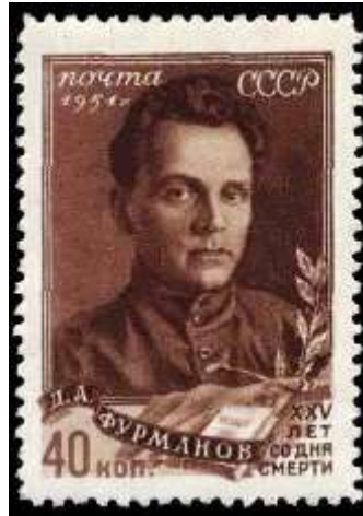
Портрет Д. А. Фурманова