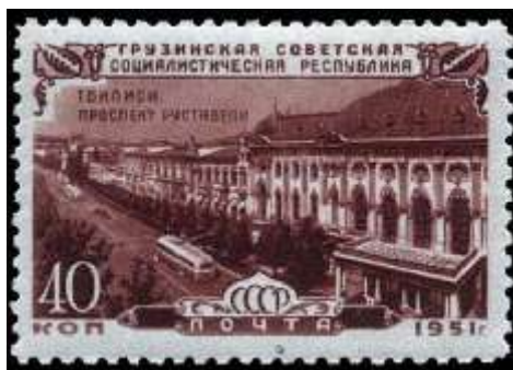
Тбилиси. Проспект Рушавели