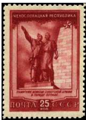
Острава. Памятник советским воинам