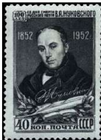
Портрет В. А. Жуковского по картине К. Брюллова (1838)