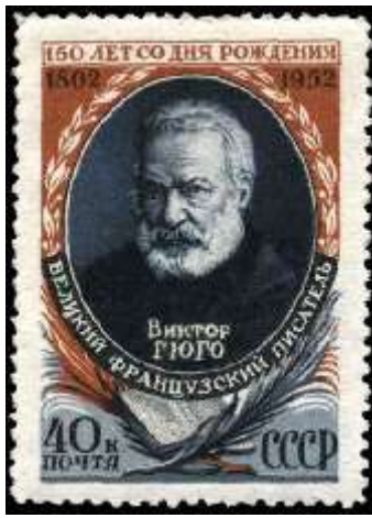
Портрет Виктора Гюго