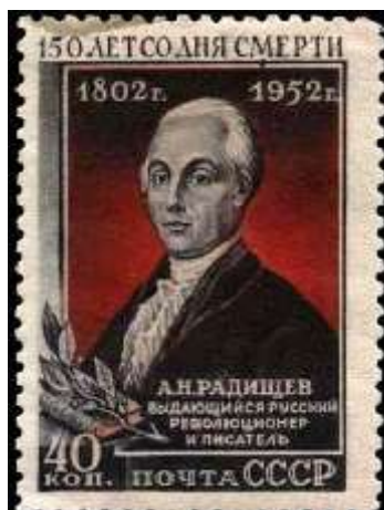
Портрет А. Н. Радищева