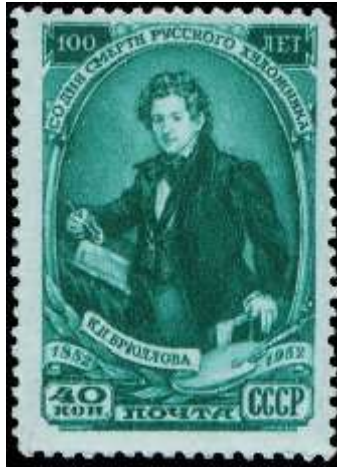
Портрет К. П. Брюллова по картине В. Тропинина (1836)