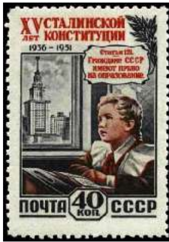
Школьница за партией