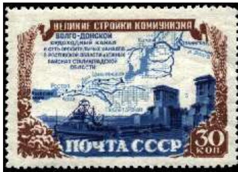
Схема Волго-Донского судоходного канала имени В. И. Ленина

Номер марки: 1654 Рейтинг марки: 50 25 20 Год выпуска: 1951 Месяц выпуска: 11 Номинал: 30 к. Печать: офсет Зубцовка: линейная 12,5 Тираж (тыс.): 1000 Название серии: Стройки коммунизма Цвет: голубая, коричневая