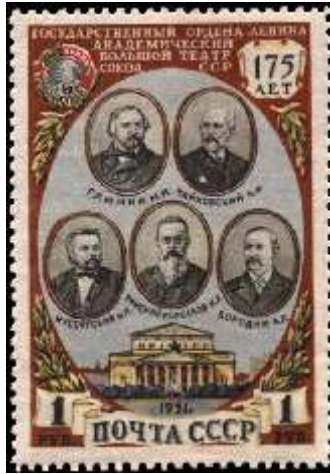
Портреты великих композиторов