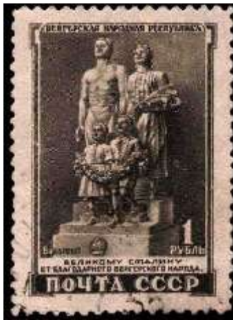
Будапешт. Скульптурная группа