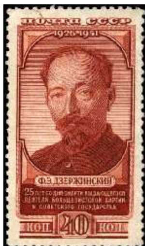
Портрет Ф. Э. Дзержинского

Рейтинг марки: 90 35 15 Год выпуска: 1951 Месяц выпуска: 6 Номинал: 2 р. Печать: глубокая Бумага: с цветным фоном Зубцовка: линейная 12,5 Тираж (тыс.): 500 Название серии: Сельское хозяйство в СССР Цвет: темно-зеленая на розовом фоне