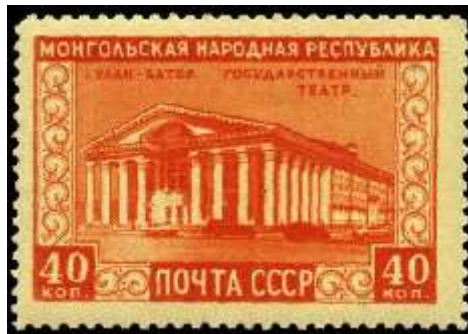
Улан-Батор. Государственный театр