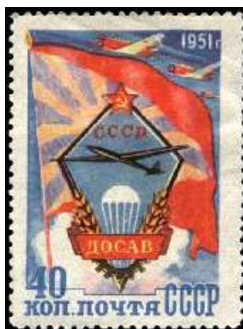
Эмблема и флаг Добровольного общества содействия авиации (ДОСАВ)

Название серии: Композиторы Цвет: коричневая на розовом фоне