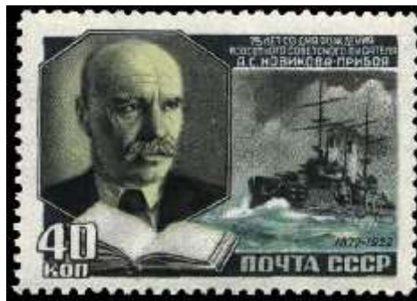
Портрет А. С. Новикова-Прибоя