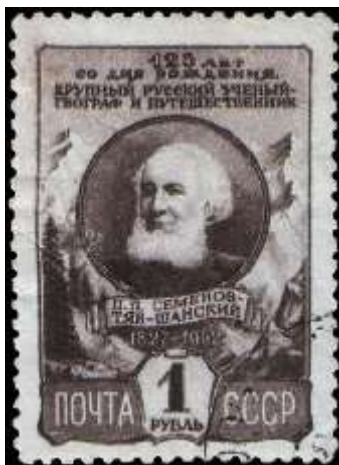
Портрет П. П. Семенова-Тян-Шанского на фоне горных хребтов