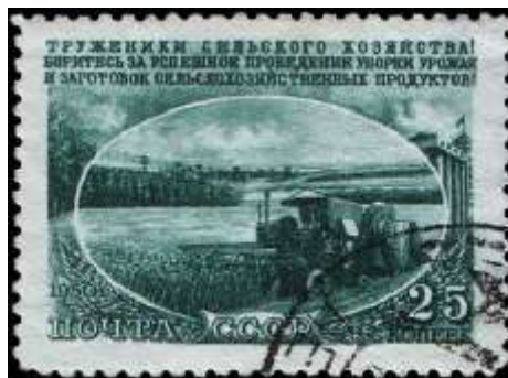
Комбайн на уборке урожая