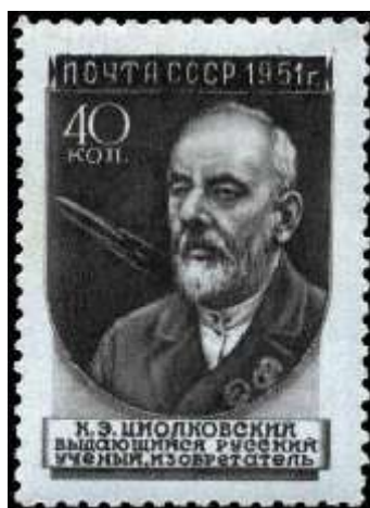
К. Э. Циолковский (1857-1935)