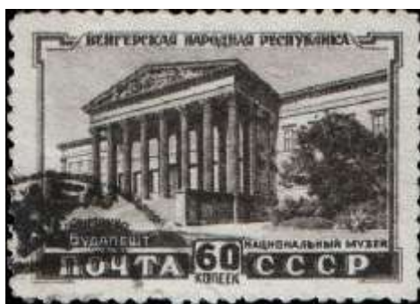
Будапешт. Национальный музей (арх. М. Поллак, 1837-1847)