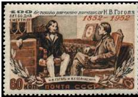
Н. В. Гоголь и В. Г. Белинский (по рисунку Б. Лебедева)