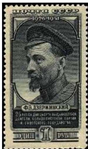
Портрет Ф. Э. Дзержинского

Номер марки: 1622 Рейтинг марки: 80 35 8 Год выпуска: 1951 Месяц выпуска: 8 Номинал: 40 к. Печать: металлография Бумага: плотная Зубцовка: линейная 12,5 Тираж (тыс.): 2000 Доп. сведения: С гравюры. Название серии: 25-летие со дня смерти Ф. Э. Дзержинского (1877-1926) Цвет: кирпично-красная