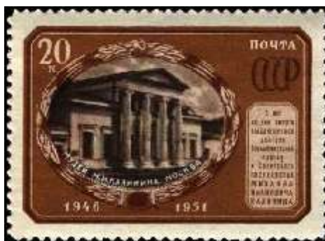
Москва. Государственный музей М. И. Калинина

Год выпуска: 1951 Месяц выпуска: 8 Номинал: 1 р. Печать: металлография Бумага: плотная Зубцовка: линейная 12,5 Тираж (тыс.): 1000 Доп. сведения: С гравюры. Название серии: 25-летие со дня смерти Ф. Э. Дзержинского (1877-1926) Цвет: черно-синяя