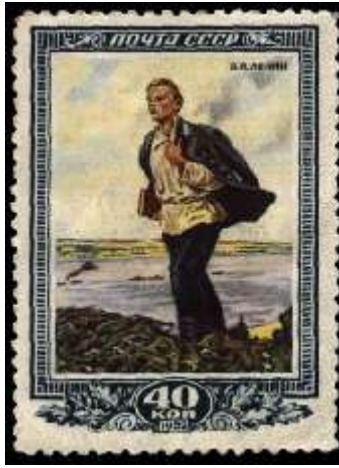
"Юность В. И. Ленина" (фрагмент картины В. Прагера, 1950)