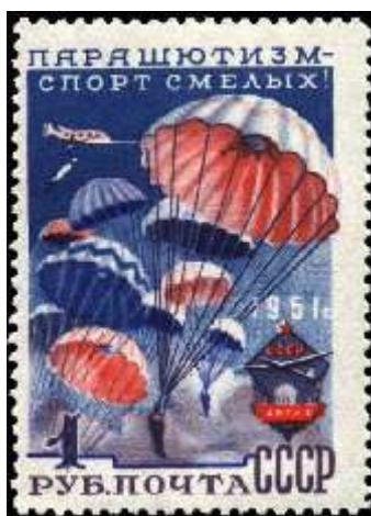
Групповой прыжок с парашютом