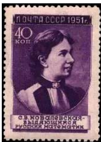
С. В. Ковалевская (1850-1891)

Название серии: Ученые нашей Родины Цвет: зеленая