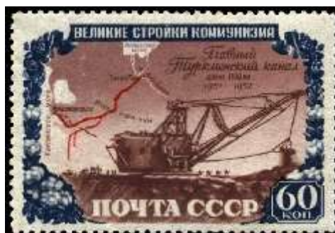
Шагающий экскаватор на строительстве Главного Туркменского канала

Номер марки: 1655 Рейтинг марки: 200 100 25 Год выпуска: 1951 Месяц выпуска: 11 Номинал: 40 к. Печать: офсет Зубцовка: линейная 12,5 Тираж (тыс.): 1000 Название серии: Стройки коммунизма Цвет: сине-зеленая, коричневая, красная