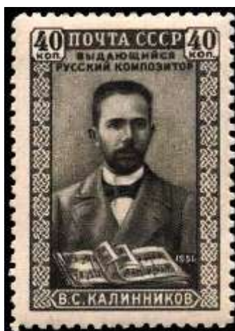
Портрет В. С. Калинникова (1866-1901)