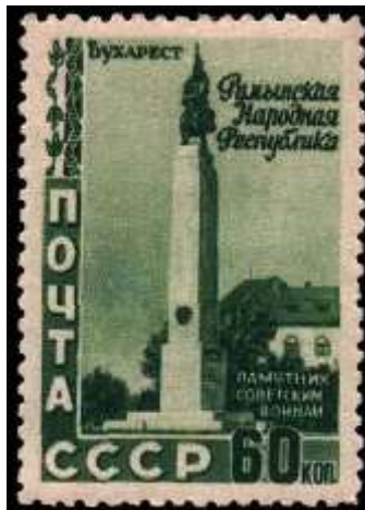
Бухарест. Памятник советским воинам (ск. К. Бараски)