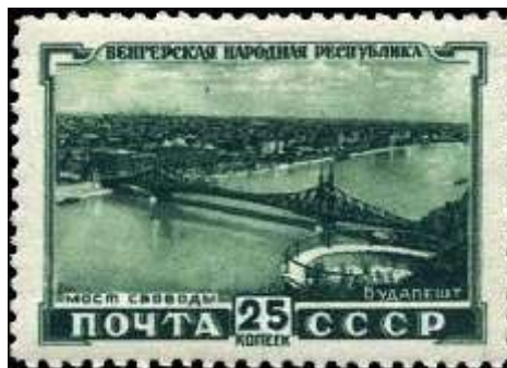
Будапешт. Мост Свободы