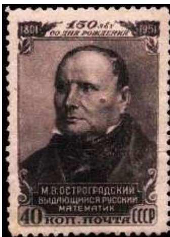
Портрет М. В. Остроградского