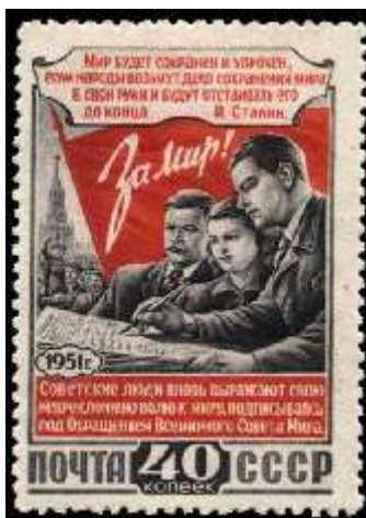
Советские люди подписываются под Обращением Всемирного Совета Мира о заключении Пакта мира между пятью великими державами

Номер марки: 1657 Рейтинг марки: 800 300 20 Год выпуска: 1951 Месяц выпуска: 11 Номинал: 1 р. Печать: офсет Зубцовка: линейная 12,5 Тираж (тыс.): 1000 Название серии: Стройки коммунизма Цвет: многоцветная