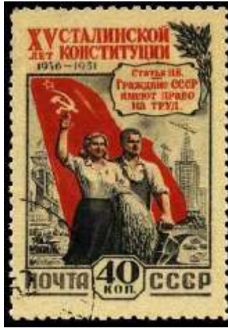
Рабочий и колхозница у красного знамени