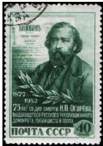
Портрет Н. П. Огарева по гравюре М. Леммеля