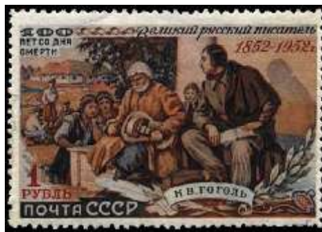
Н. В. Гоголь с кобзарем