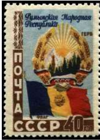
Государственный герб и флаг республики