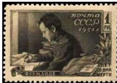
Д. А. Фурманов за рабочим столом