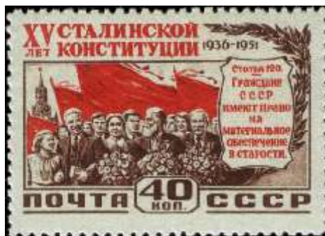
Трудящиеся на фоне красных знамен и Спасской башни Московского Кремля

Цвет: коричневая, серая, красная на зеленой бумаге