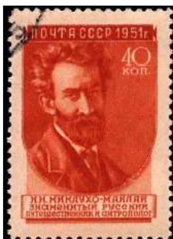
Н. Н. Миклухо-Маклай (1846-1888)