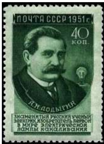
А. Н. Лодыгин (1847-1923)

Название серии: Ученые нашей Родины Цвет: темно-серая