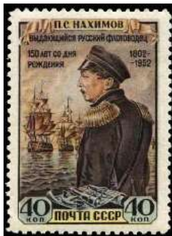
Портрет П. С. Нахимова по литографии В. Тимма (1851-1862)