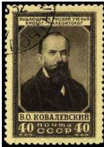
Портрет В. О. Ковалевского

Номер марки: 1673 Рейтинг марки: 80 40 15 Год выпуска: 1952 Месяц выпуска: 3 Номинал: 40 к. Печать: глубокая Бумага: цветная Зубцовка: линейная 12,5 Тираж (тыс.): 1000 Название серии: В. О. Ковалевский (1842-1883) Цвет: черная на желтой бумаге