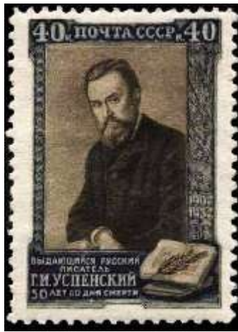
Портрет Г. И. Успенского по картине Н. Ярошенко (1884)