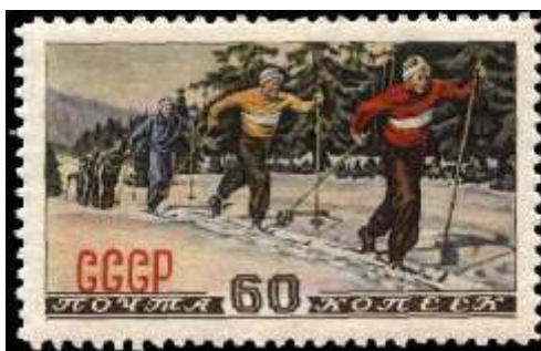
Лыжный спорт. Кросс