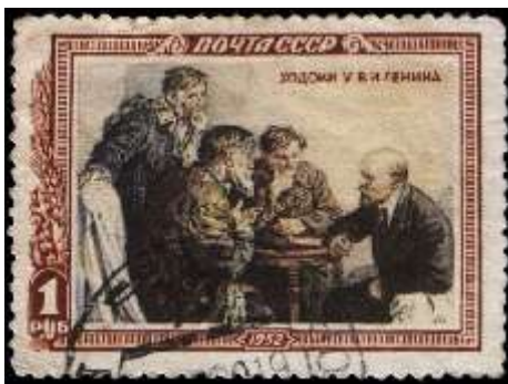
"Ходоки у В. И. Ленина" (по картине В. Серова, 1950)