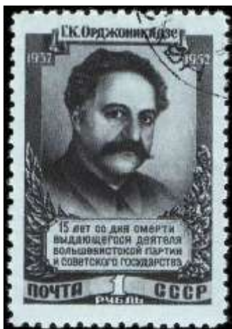
Портрет Г. К. Орджоникидзе