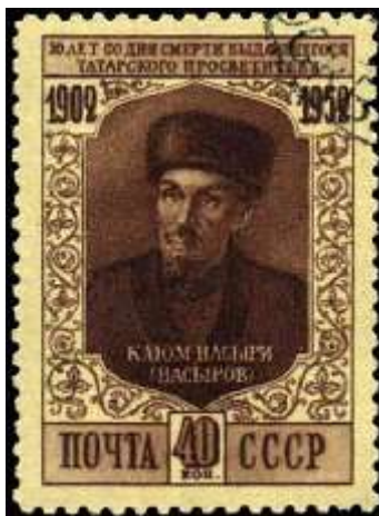
Портрет К. Насыри