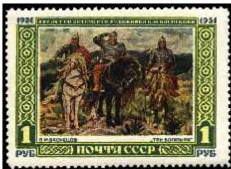
"Богатыри" (по картине В. М. Васнецова, 1881-1898)