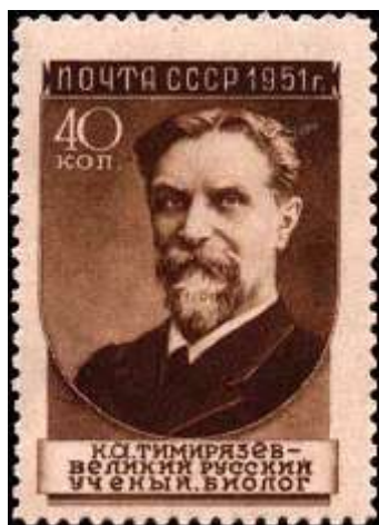
К. А. Тимирязев (1843-1920)

Цвет: темно-синяя на светло-голубой бумаге