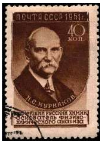
Н. С. Курнаков (1860-1941)