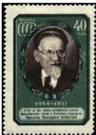
Портрет М. И. Калинина

Номер марки: 1624 Рейтинг марки: 30 15 2 Год выпуска: 1951 Месяц выпуска: 8 Номинал: 20 к. Печать: офсет Зубцовка: линейная 12,5 Тираж (тыс.): 1000 Название серии: 5-летие со дня смерти М. И. Калинина (1875-1946) Цвет: лилово-коричневая, красно-коричневая