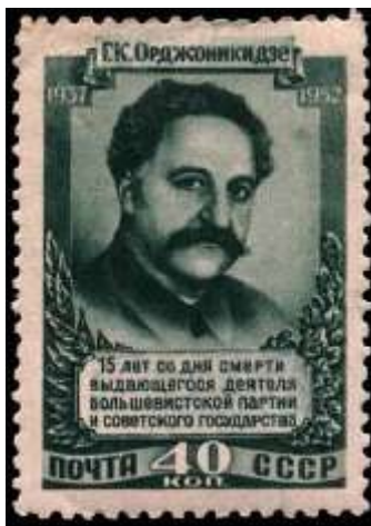
Портрет Г. К. Орджоникидзе