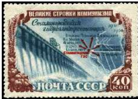
Плотина Сталинградской ГЭС (ныне Волжская ГЭС имени XXII съезда КПСС)

Номер марки: 1654 Рейтинг марки: 50 25 20 Год выпуска: 1951 Месяц выпуска: 11 Номинал: 30 к. Печать: офсет Зубцовка: линейная 12,5 Тираж (тыс.): 1000 Название серии: Стройки коммунизма Цвет: голубая, коричневая