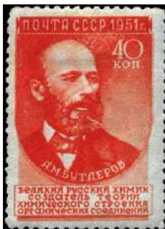
А. М. Бутлеров (1828-1886)

Название серии: Ученые нашей Родины Цвет: коричневая