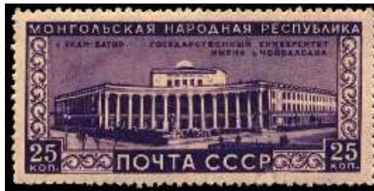
Улан-Батор. Государственный университет имени Чойбалсана