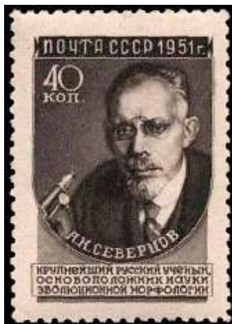
А. Н. Северцов (1866-1936)